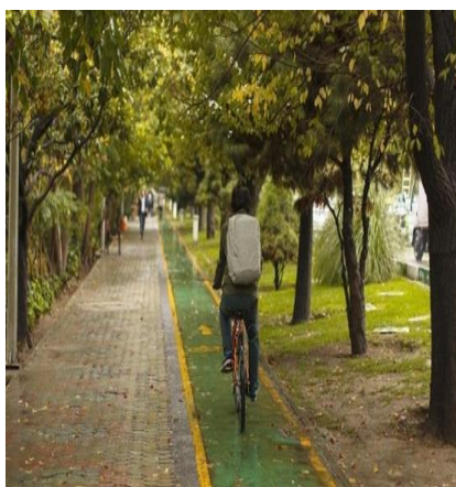
تصویر ۵. وجود مسیر دوچرخه‌سواری محافظت شده در بلوار کشاورز