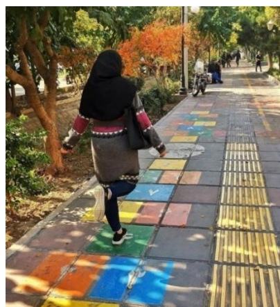
تصویر ۴. امکانات مناسب به منظور سرگرم شدن افراد در بلوار کشاورز