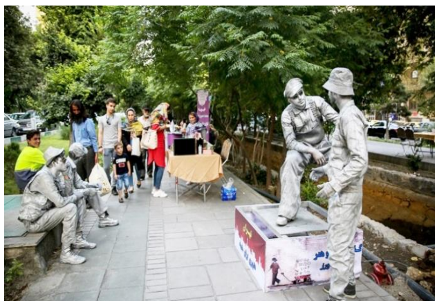
تصویر ۲. برگزاری مراسم فرهنگی در بلوار کشاورز