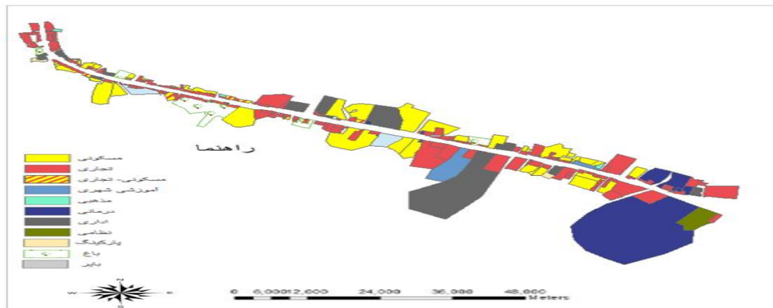
شکل ۳. توزیع کاربری‌های مجاور خیابان دکتر مطهری شهر رامسر

می‌سازد؛ با این حال، استقبال شهروندان از آن بسیار زیاد است به گونه‌ای که در روزهای پایانی سال، هیاهو و حضور جمعیت به اوج خود می‌رسد. که البته بنابر مشاهدات، از ایمنی کافی در برابر خودروها برخوردار نیستند. مغازه‌های تجاری، خرده فروشی بوده و پاسخگوی نیازهای روزمره، هفتگی و ماهیانه شهروندان است. خیابان مطهری دارای مراکز درمانی، مجتمع‌های پزشکی بسیار متنوع می‌باشد که در جذب افراد برای ورود به این خیابان بسیار تأثیرگذار است. همچنین بلوار رزاقی داری ادارات مهم می‌باشد و از طرفی دارای جاذبه‌های گردشگری شهر رامسر می‌باشد، که در جذب افراد به این خیابان بسیار تأثیرگذار است (شکل ۳ و ۴).