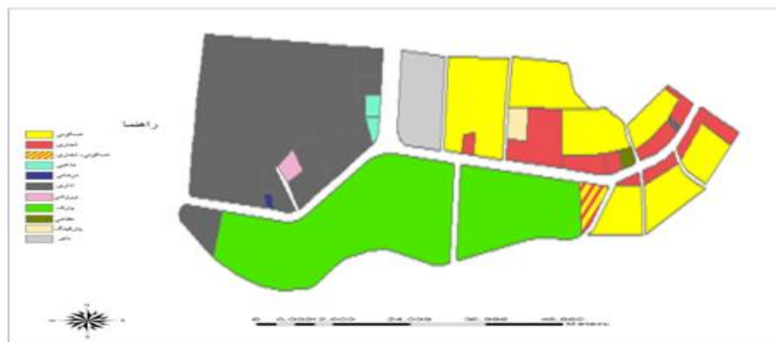
شکل ۴. توزیع کاربری‌های مجاور بلوار شهید رزاقی شهر رامسر