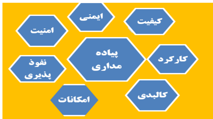
شکل ۱. متغیرهای پژوهش