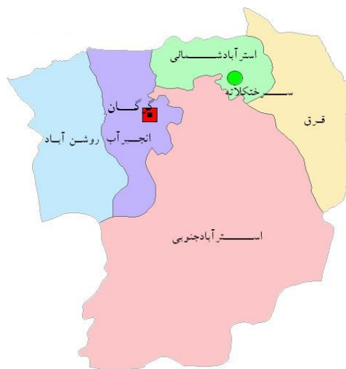
شکل ۱. نقشه تقسیمات سیاسی شهر سرخنکلاته