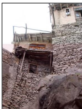
شکل ۵. نمونه های از ابنیه روستای کنگ

ابنیه مرمتی و قابل نگهداری: ساختمان هایی که برای بالا بردن عمر آنها با توجه به استاندارد واحدهای مسکونی باید در آن تغییراتی ایجاد گردد. در روستای کنگ ۱۷ درصد از این بناها موجود است.