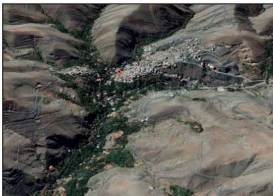
شکل ۱. عکس هوایی روستای کنگ

روستای کنگ در محدوده دهستان جاغرق از بخش طرقيه شهرستان شانديز، استان خراسان رضوی، در طول جغرافیایی 13^{\circ} 59' و عرض جغرافیایی 19^{\circ} 36' واقع شده و در دامنه کوه روخی با ارتفاع بیش از ۲۰۰۰ متر جای گرفته است. روستای کنگ تشکیل شده از ارتفاعات و دره‌های با شیب تند که تاثیر خود را بر سیمای روستا، معابر و مسکن روستا گذاشته است.