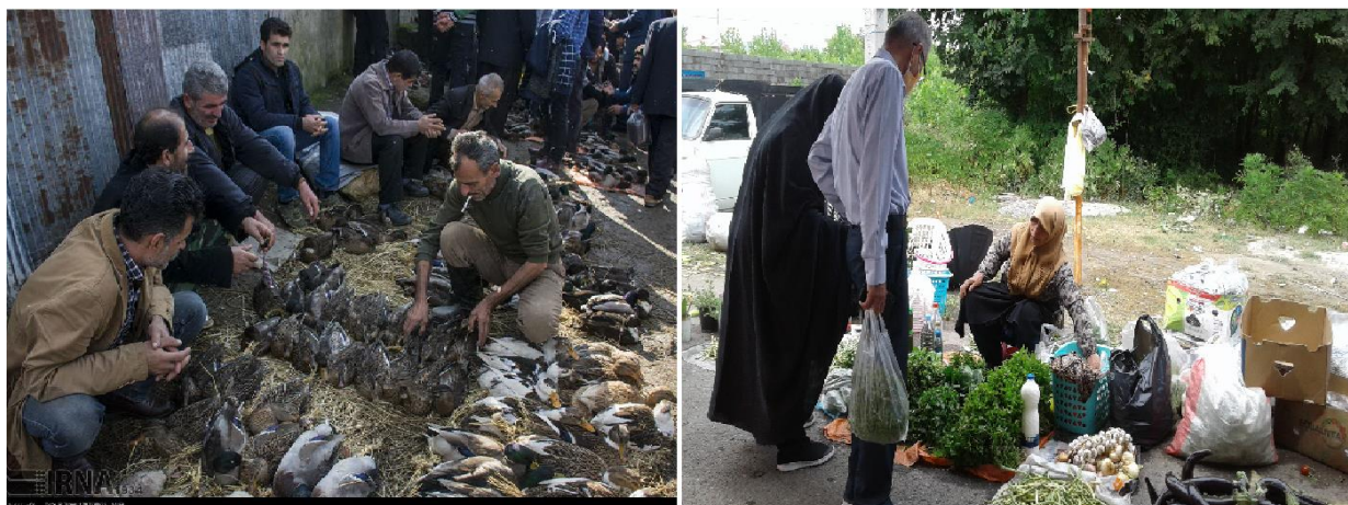
تصویر ۲. عرضه مستقیم محصولات محلی ارگانیک در بازار هفتگی تولم شهر (صومعه سرا)

با توجه به کثرت و پراکندگی بازارهای هفتگی در شهرستان صومعه سرا بطوریکه در تمام ایام هفته در اکثر شهرهای آن بازار هفتگی برگزار می‌شود. و تاثیر بسزایی بر مولفه‌های اثرگذار بر خانوارها می‌گذارد. بطوریکه در بررسی‌های به عمل آمده حدود ۵۴/۲۹ درصد این بازارهای هفتگی بر درآمد خانوارها تاثیر مستقیم می‌گذارد و حدود ۶۱/۰۲ درصد بر مولفه اشتغال اثرگذار می‌باشد بطوریکه اکثر جوانان با کم‌ترین سرمایه مبادرت به فروش محصولات بومی و محلی محدوده تحقیق می‌کنند (جدول ۷).