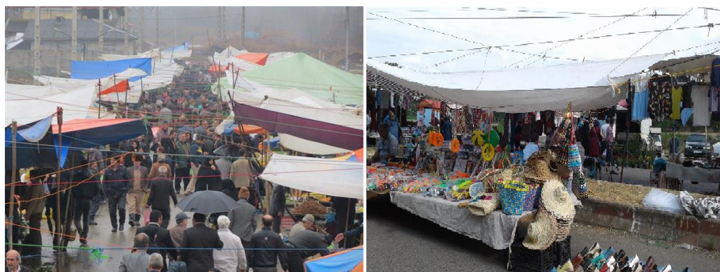
تصویر ۱. نمای از شلوغی پنجشنبه بازار در تولم شهر (جمعه بازار) شهرستان صومعه سرا

در بازارهای شهرستان صومعه سرا مردم از شهرهای رشت، فومن و صومعه سرا و ساکنین خانه‌های دوم سایر استان‌ها برای خرید انواع مواد غذایی و برنج، چای، سبزی‌های تابستانی، مرغ، تخم‌مرغ، گوشت و ماهی به این بازار مراجعه می‌کنند یکی از این بازارهای شلوغ جمعه بازار در ۵ کیلومتری صومعه سرا و ۱۷ کیلومتری رشت واقع است که قبلاً در این محل روزهای جمعه، بازار تشکیل می‌شد. اما بعد از انقلاب روز تشکیل به پنجشنبه تغییر یافته است و یکشنبه بازار صومعه سرا است که این شهر با تولید محصولات متنوع مانند انواع سبزی‌ها، میوه‌ها، برنج، چای، دام، طیور، نیشکر و ابریشم و فروش آن‌ها به ساکنان مناطق مختلف دارای یک بازار هفتگی پررونق است. در این بازار زنان روستایی به فروش نیشکر، دوشاب (شیره انگور)، انواع سبزی و مرغ و تخم مرغ و فرآورده‌های دامی مشغول هستند (تصویر ۱).