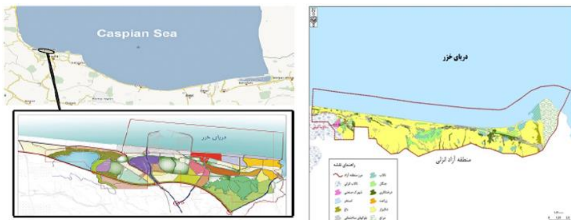
شکل ۲. موقعیت منطقه و سایت منطقه آزاد انزلی

گویشاد از دهستان گتسر بخش خمام و روستاهای گورابجیر، فشتگه دوم، فتاتو، جفرود بالا، چاپارخانه از دهستان چاپارخانه بخش خمام از شهرستان رشت را در بر می‌گیرد که شامل ۱۴ آبادی می‌باشد. در سال ۱۳۹۵ کل جمعیت این آبادی‌ها ۱۷۲۵۶ نفر بوده است. در این سرشماری سهم این روستاها از جمعیت روستایی استان ۱/۴۶٪ بوده که در مطالعات راهبردی منطقه حاکی از آنست که در سرشماری‌های اخیر، سهم جمعیت آبادی‌های منطقه از جمعیت روستایی استان در حال افزایش بوده است (شکل ۲).