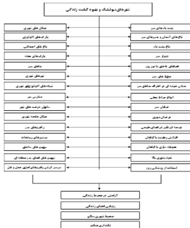
شکل ۱. مدل مفهومی تدوین الگوی شاخص های بیوفیلیک در محور گردشگری