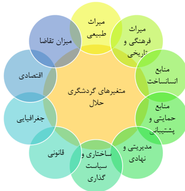
شکل ۴. متغیرهای گردشگری حلال

برای تعیین روایی محتوای سؤالات پرسشنامه از نظرات کارشناسی اساتید و متخصصان مرتبط با این موضوع استفاده شد. برای تعیین روایی، محتوای سؤالات پرسش نامه از نظرات کارشناسی اساتید و متخصصان مرتبط با گردشگری، برنامه‌ریزی شهری استفاده و همچنین پایایی آن از طریق آلفای کرونباخ تعیین شد. برای توصیف و تحلیل داده‌ها، از آزمون‌های آماری در قالب نرم‌افزار SPSS ۲۵ استفاده گردید، به‌منظور انجام آزمون توصیفی مؤلفه‌ها و متغیرها از آزمون تی، تعیین شدت و نوع رابطه بین مؤلفه‌ها از آزمون همبستگی، تخمین روابط و وزن‌های متغیرها از رگرسیون استفاده شد.