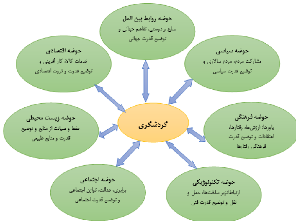
شکل ۱. حوزه‌های گردشگری (منبع: سرور، نورانی، ۱۳۹۱: ۸)

گردشگری پایدار سعی در تنظیم روابط بین جامعه میزبان، میهمان و مکان گردشگری دارد که این روابط می‌تواند پویا و سازنده بوده، آسیب‌های محیطی و فرهنگی را به حداقل رسانده، رضایت گردشگران را فراهم آورده، موجب اشتغال‌زایی و رشد و توسعه اقتصادی جوامع محلی گردد، در تقویت فرهنگ محلی، حفظ و بازسازی محیط‌زیست طبیعی و انسان‌ساخت سهیم باشد و یا برعکس می‌تواند در تمامی ابعاد فوق تأثیر منفی بگذارد (Dube, 2020).