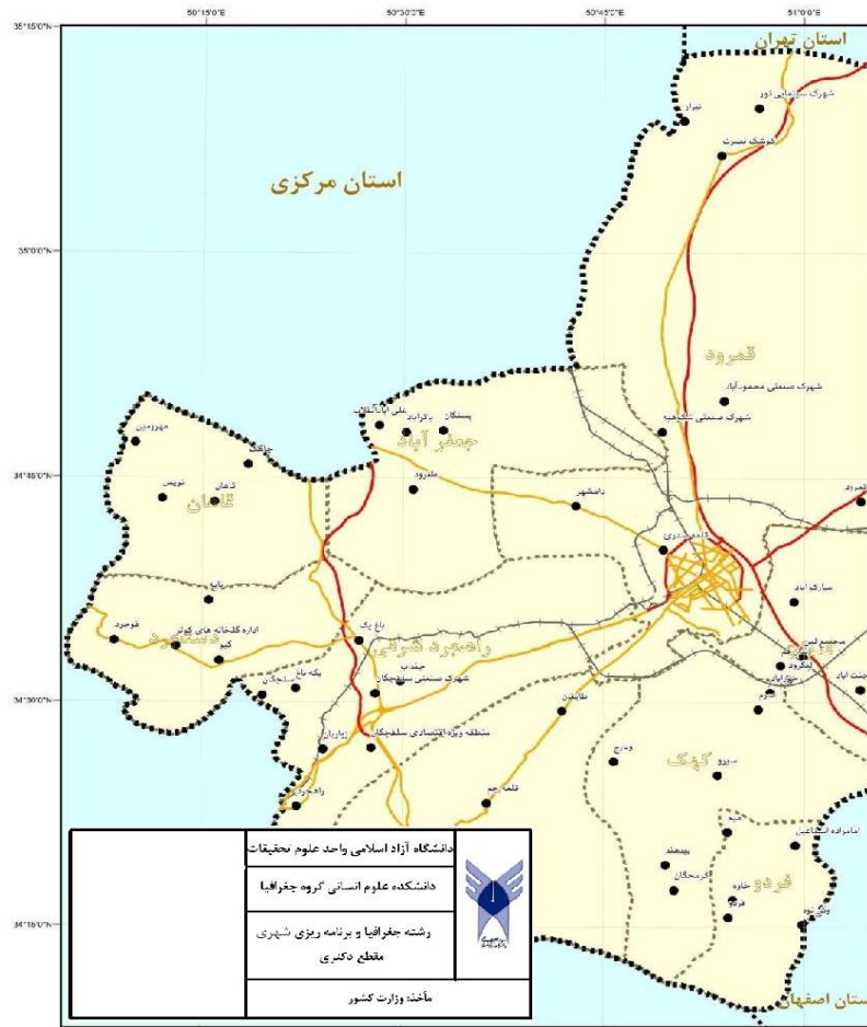
شکل ۵. نقشه موقعیت استان قم