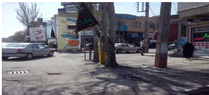
شکل ۶. تصویر وضعیت باجه تلفن در محدوده مورد مطالعه

معلولین و جانبازان در نظر گرفته نشده است. رنگ کیوسک زرد و تلفن سیاه می‌باشد. هر سه باجه تلفن موجود از مکان‌هایی مناسبی برخوردار نیستند به صورتی که دو مورد از آنها در کنار جوی آب و یکی از آنها نیز در منتهی علیه سمت چپ خیابان فرعی که ازدحام جمعیت و سرو صدا زیاد را به همراه دارد، نصب شده است؛ و همچنین در تصویر مشخص است که وجود یک درخت امکان استفاده از باجه تلفن ضلع شرقی را دشوار کرده است.