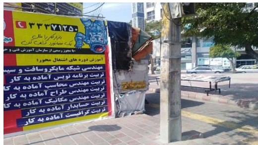
شکل ۷. تصویر وضعیت کیوسک در محدوده مورد مطالعه

در این محدوده کلاً یک نوع کیوسک مطبوعاتی موجود می‌باشد که از لحاظ مکان‌یابی: در محدوده پیاده‌رو نصب شده و با وجود جدول کاری دور آن و به حریم عابرین پیاده تجاوز کرده است که سبب اختلال در رفت‌وآمد شده، از لحاظ ارگونومی فضایی به مساحت ۱,۵۰ * ۲,۵۰ سانتی متر اختصاص یافته و ارتفاع آن از زمین تقریباً ۱۰ سانتی متر می‌باشد. رنگ: رنگ کیوسک زرد می‌باشد.