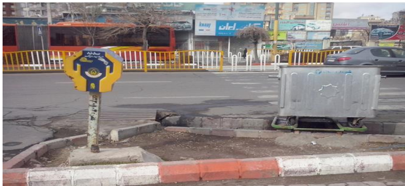
شکل ۳. تصویر وضعیت سطل زباله در محدوده مورد مطالعه

زباله‌دان‌های این منطقه از ورقه‌های فلزی می‌باشد. در این منطقه زباله‌دان‌ها به دو صورت زباله‌دان رو باز که بهم متصل شده‌اند ارتفاع آنها از سطح زمین ۸۰ سانتی‌متر می‌باشد و دیگری بصورت تکی رو به خیابان با ارتفاع ۱۲۰ سانتی‌متری می‌باشد و دارای گنجایش بیشتری می‌باشد و روی جوی‌ها مکانیابی شده‌اند. زباله‌دان‌های این منطقه به رنگ زرد و سبز با پایه‌های سیاه می‌باشد و چندین مورد آهن زنگ زده نیز دیده شد. در این منطقه یکسری از زباله‌دان‌ها با فاصله ۳۰-۵۰ سانتی‌متر از جوی و در باغچه نصب شده‌اند فاصله ی بین دو زباله‌دان ۳۰-۱۵ متر می‌باشد و یکسری از آنها عمده‌تاً روی جوی آب ساخته شده‌اند. براین اساس می‌توان گفت که زباله‌دان‌های محدوده مورد مطالعه از استانداردهای لازم برخوردار نیستند.