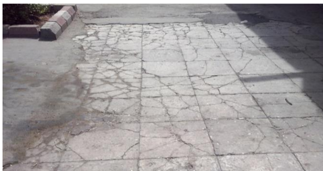
شکل ۴. تصویر وضعیت کفپوش‌ها در در محدوده مورد مطالعه