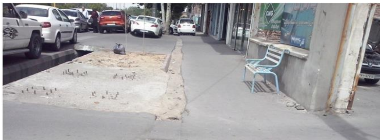
شکل ۲. تصویر وضعیت موجود نیمکت در محدوده مورد مطالعه

در این محدوده اکثر نیمکت‌ها در قسمت فضای سبز و تقریباً پارک مانند خلاصه شده و در بقیه مناطق به شدت نیاز است. به لحاظ استاندارد نیز جنس نیمکت‌ها عمدتاً فلزی و بتنی است و در فصول سرد کارآیی خاصی ندارند فقط در دو جا از محدوده از صندلی‌های چوبی استفاده شده آن‌ها نیز از کیفیت مطلوبی برخوردار نیستند. صندلی‌های موجود در محدوده فاقد رنگ‌کاری مناسب می‌باشد که اکثراً به رنگ آبی و زنگ زده می‌باشند. اندازه ارتفاع و عرض نیمکت بر اساس استاندارد طراحی نشده و از پراکنش و جانمایی مطلوبی برخوردار نیستند. برخی از آنها مستحکم به زمین نصب نشده‌اند و پایه‌های نیمکت به درستی پی‌ریزی نشده است.