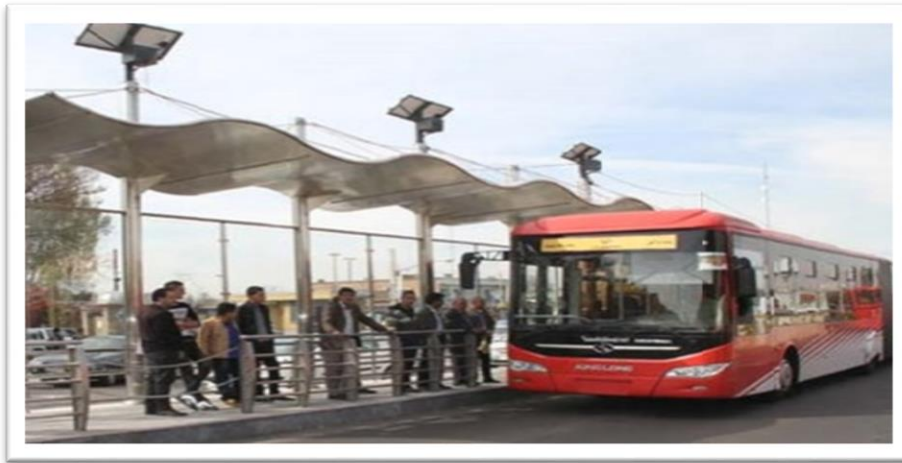
شکل ۵. تصویر وضعیت ایستگاه اتوبوس در محدوده مورد مطالعه